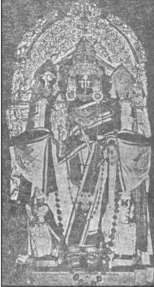
ಬೇಲೂರಿನ ಈಗ ಪೂಜೆಗೊಳ್ಳುತ್ತಿರುವ ನಾರಾಯಣಮೂರ್ತಿ

ಶಾಸನ : ಜಿಷ್ಣುವಿಷ್ಣು ಮಹಿಪಾಳಃ ಪಾಳಿತಾಖಿಳಭೂತಳಃ ದೇವದೇವೇಶ ವಿಜಯನಾರಾಯಣಮಚೀಕರತ್ || ಎಪಿ.ಕ. ಸಂಪುಟ-೯ (೧೯೯೦) ಶಾ. ೧.ಪು. ೧.