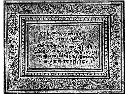
ಕೆಳದಿ ಜೋಯಿಸರ ಮನೆಯಲ್ಲಿದ್ದ ತಿಗಳಾರಿ ಲಿಪಿ ಕೃತಿಯ ಲಿಫೋ ಮುದ್ರಿತ ಪ್ರತಿ

ಒಟ್ಟಿನಲ್ಲಿ ತಿಗಳಾರಿ ಹಸ್ತಪ್ರತಿ ಜ್ಞಾನಭಂಡಾರಗಳನ್ನು ಮುಂದಿನ ಪೀಳಿಗೆಗೆ ಉಳಿಸಲು ಕೆಳದಿ ಹಸ್ತಪ್ರತಿ ಸಂಪನ್ಮೂಲ ಕೇಂದ್ರದಿಂದ ಹೋರಾಟ ಕೈಗೊಂಡಿದ್ದು, ಇದನ್ನು ಬಲಡಿಸಲು ಬುದ್ಧಿಜೀವಿಗಳಾದಿಯಾಗಿ ಸಮಸ್ತರೂ ಕೈಜೋಡಿಸಿ ಇದಕ್ಕೆ ಬೆಂಬಲಿಸಲು ಕಳಕಳಿಯಿಂದ ಮನವಿ ಮಾಡಿಕೊಳ್ಳುವೆನು.